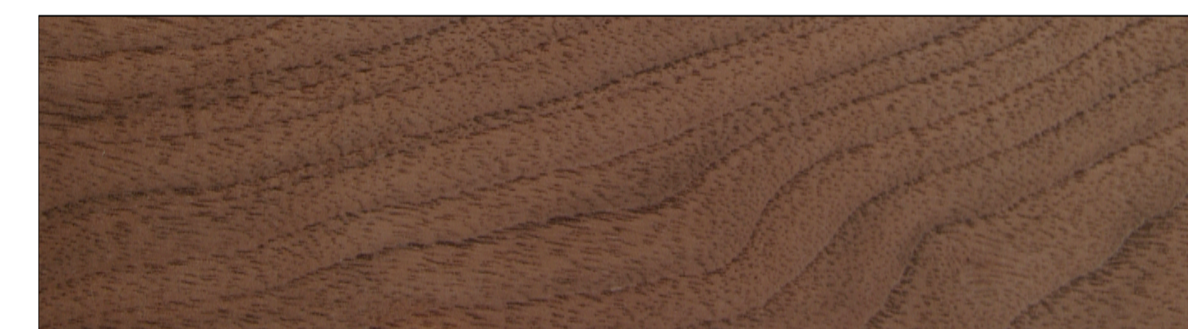
WALNUT _ WALNUSS