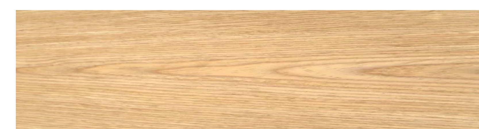
OAK _ EICHE